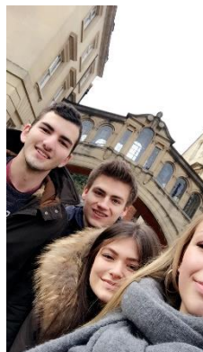
Bridge of sighs