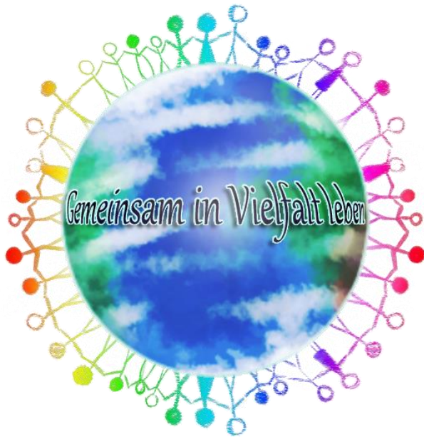
Grafik: Stefanie Doreuli, Wilhelm-Raabe-Schule Lüneburg